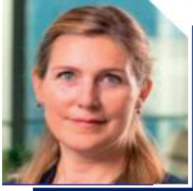
Table ronde 1 : Libérer l'entreprise par la simplification

Stabiliser-Simplifier-Stimuler : 3 clés du succès pour innover ?